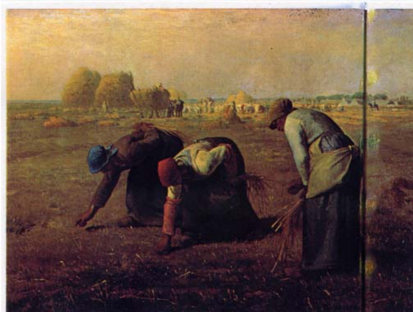
落ち穂拾い Glaneuses, Millet