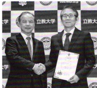
立教大学の吉岡総長と周防監督