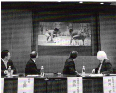
学生らが作ったビデオメッセージを見る監督たち

周防監督は会見で「多くの学生が相撲を経験できるよう環境作りに関わりたい」と話した。今後の計画としては新入生向けビデオメッセージの作成や一般学生による相撲大会「周防正行杯」の開催などを