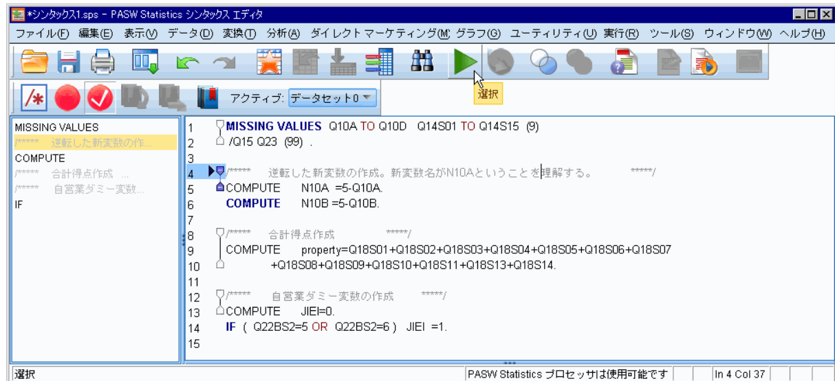
図3. シンタックス・ウィンドウの例

次の図の中は、欠損値処理MISSING VALUES、COMPUTE文による回答方向を逆転した新変数作成、合計得点作成、自営業ダミー変数作成の例。これらを書き、実行したい部分を選択し、実行ボタン（▲のボタン）を押して（あるいは画面上の分析→実行）実行。村瀬研ホームページなどに 各種のシンタックス見本ファイル がある。それらを書き換えると簡単。