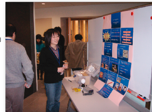
ワークショップでのポスター発表の様子